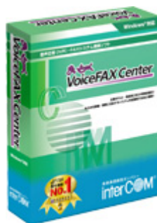
まいと〜く VoiceFAX Center ガイダンスエディタ パッケージ