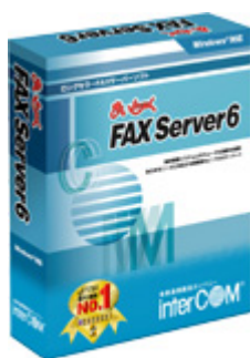
まいと〜く FAX Server 6 パッケージ

業務システムとのスムーズな連携を実現するFAXサーバー ソフト 「商品名：まいと〜く FAX Server 6（マイトーク ファックス サーバー シックス）」（発売日：2006年6月30日）